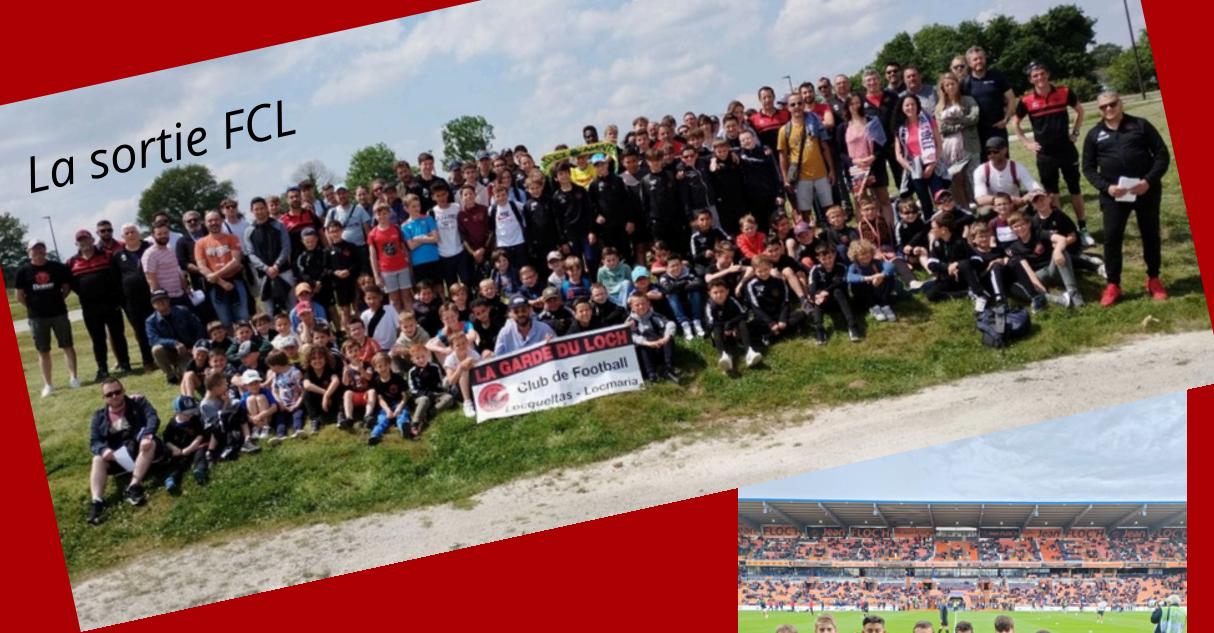
La sortie FCL